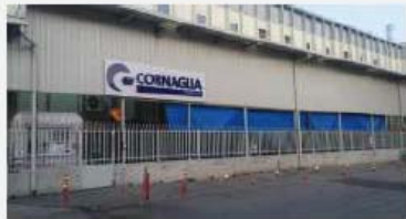
BU Plastic CORNAGLIA TURKEY NOSAB 113 SOK. no: 10-16140 Nilufer Bursa - TURKEY