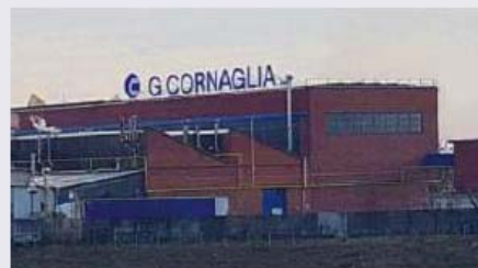
BU Metal CORNAGLIA SPA Strada Mirafiori, 31 10092 - Beinasco (TO)