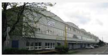
BU Plastic & Metal CORNAGLIA POLAND ul. Grazyńskiego 141 R.I. di Bielsko-BIALA (PL) 7443