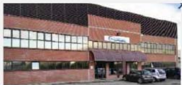
BU Plastic CORNAGLIA SUD Via Sorlati, 50 82011 - Airota (BN)