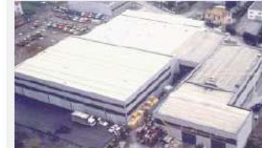
BU Filtration COR-FILTERS SRL Via Alcide de Gasperi, 50 16030 - Casarza Ligure (GE)