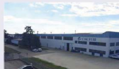
BU Exhaust CORNAGLIA SPA Via San Michele, 33 14017 - Valfenera (AT)