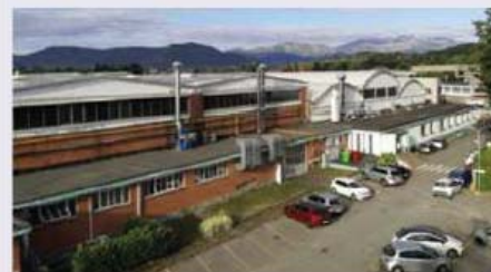
BU Plastic CORNAGLIA SPA Via Rivoli, 118 10090 - Villarbasse (TO)