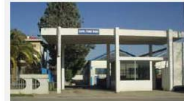
BU EXHAUST COR-TUBI SUD Strada Statale 154 km 6 66041 Ateusa (CH)