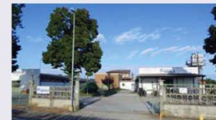
BU Innovation Centre CORNAGLIA SPA Borgo Brassicarda, 18 14019 - Brassicarda (AT)