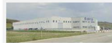
BU EXHAUST COR-TUBI ROMANIA Titesti, Sat Valea Stanii, nr 277-A 117754, Arges - Romania